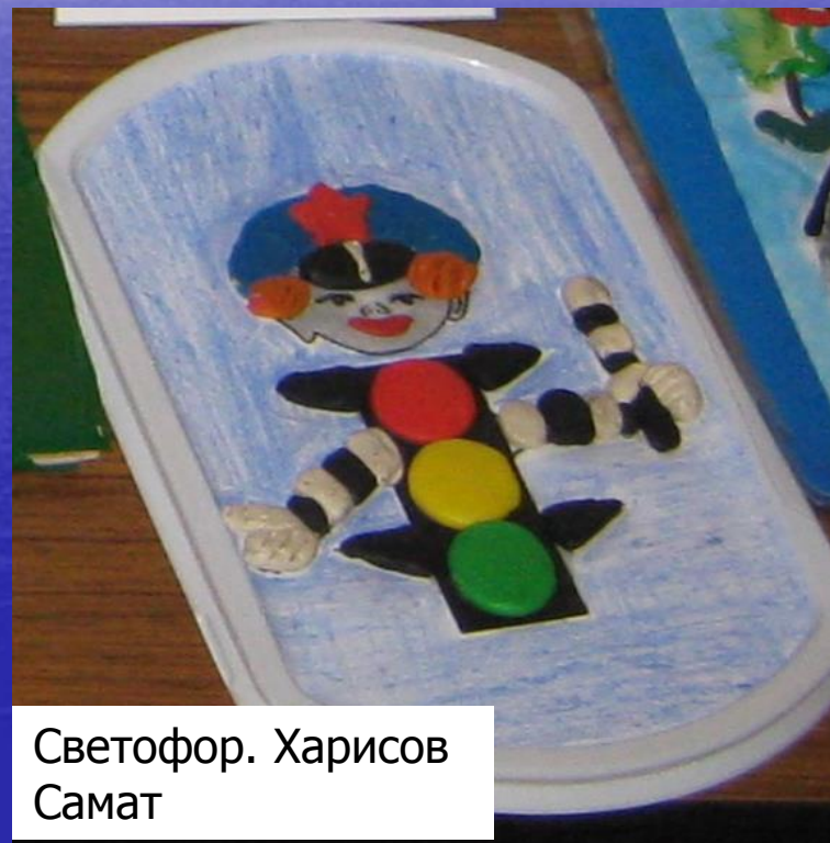
Светофор. Харисов Самат

Разукрашивание раскраски пластилином по контурам